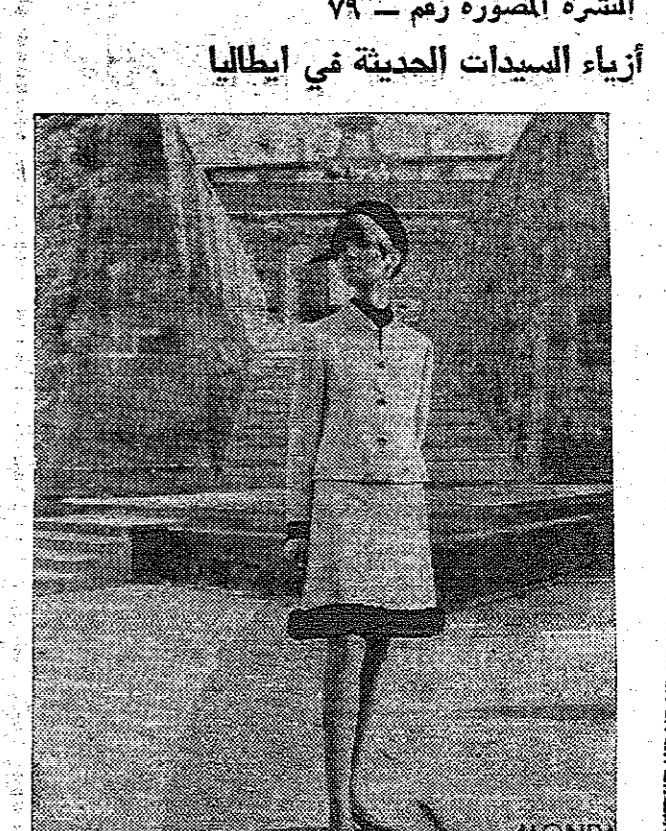
روما ( مودرن ) هذا الطقم الكامل يخص المجلات اللبنة ، مصنوع من الصوف اللين ووضع عليه اللون من الفيزون المني اللين ، وجدير الانتباه ان هذا الموديل من تصميم اعداد مؤسسة اخوان بوناتا